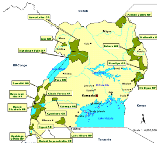
Katara Point, de locatie die we op het oog hebben, nabij National Park Murchison Falls