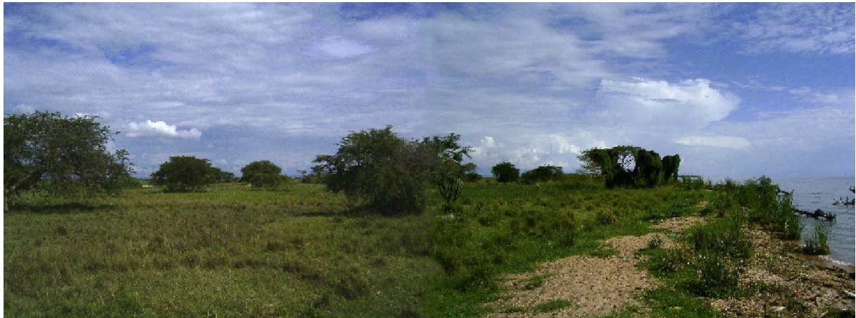
Katara Point: een groen en vlak terrein met (straks) een aflopend zandstrandje aan de oever van Lake Albert

De afgelopen maanden zijn we dan ook druk doende geweest om overal informatie vandaan te halen. Hoe zet je zo'n project eigenlijk op? Wat gaat het eigenlijk allemaal kosten? Waar moeten we allemaal rekening mee houden? Kortom, we hebben nog altijd heel wat uit te zoeken. Maar ondertussen krijgt het project wel een steeds duidelijker vorm.