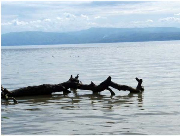
Het uitzicht op de 'Blue Mountains' van Congo