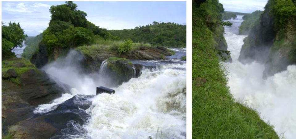
Met bulderend geraas stort de Nijl zich door de Murchison Falls

Katara Point ligt op ongeveer een uur rijden van de 'provinciestad Masindi'; je bent in een half uur bij het pontje voor een gamedrive en het is ook niet ver van de werkelijk zeer indrukwekkende Murchison Watervallen (de smalste doorgang van de Nijl).